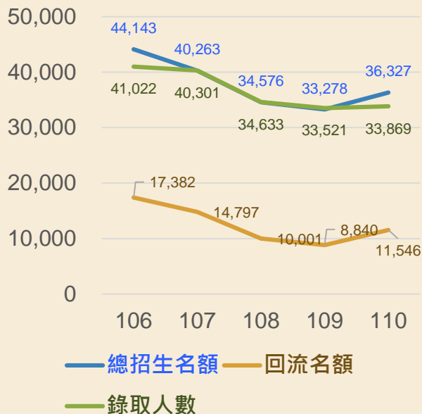
總招生名額、回流名額及錄取人數